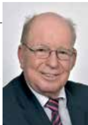
Willy Hauser, Heilpraktiker Präsident des Deutschen Naturheilkundes eV